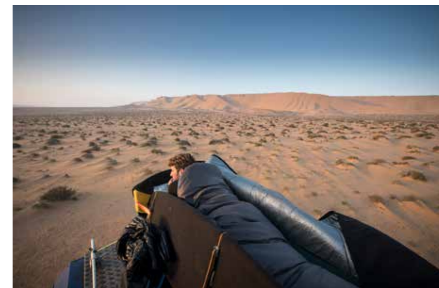
Geen kameel maar de brandweervagen.