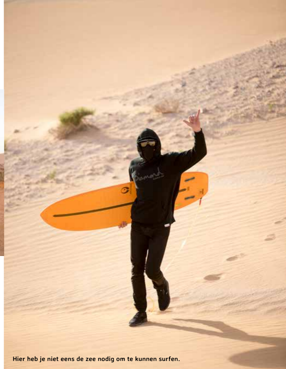
Hier heb je niet eens de zee nodig om te kunnen surfen.

rist die een stopbord negeert. En natuurlijk negeert Marco het stopbord vlak buiten de haven, want in de wijde omgeving is geen auto te bekennen. Zonde van de diesel om zo'n machine dan stil te zetten. De politieagent stapt kordaat achter een rots vandaan, witte hand-