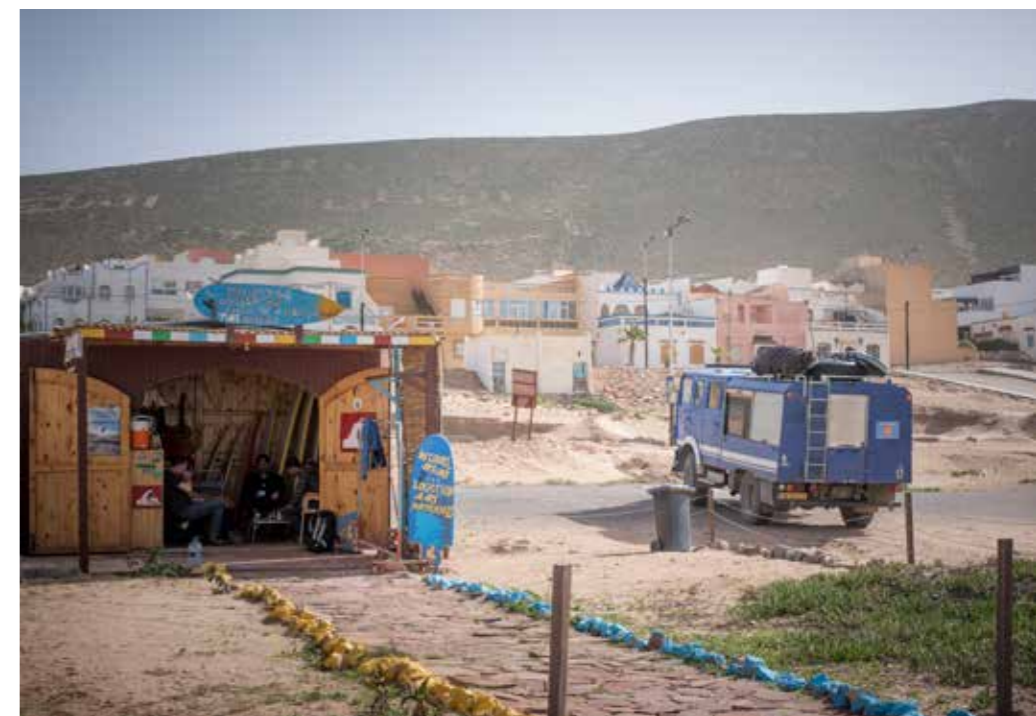
De Marokkaanse kust is een eldorado voor de surfer.