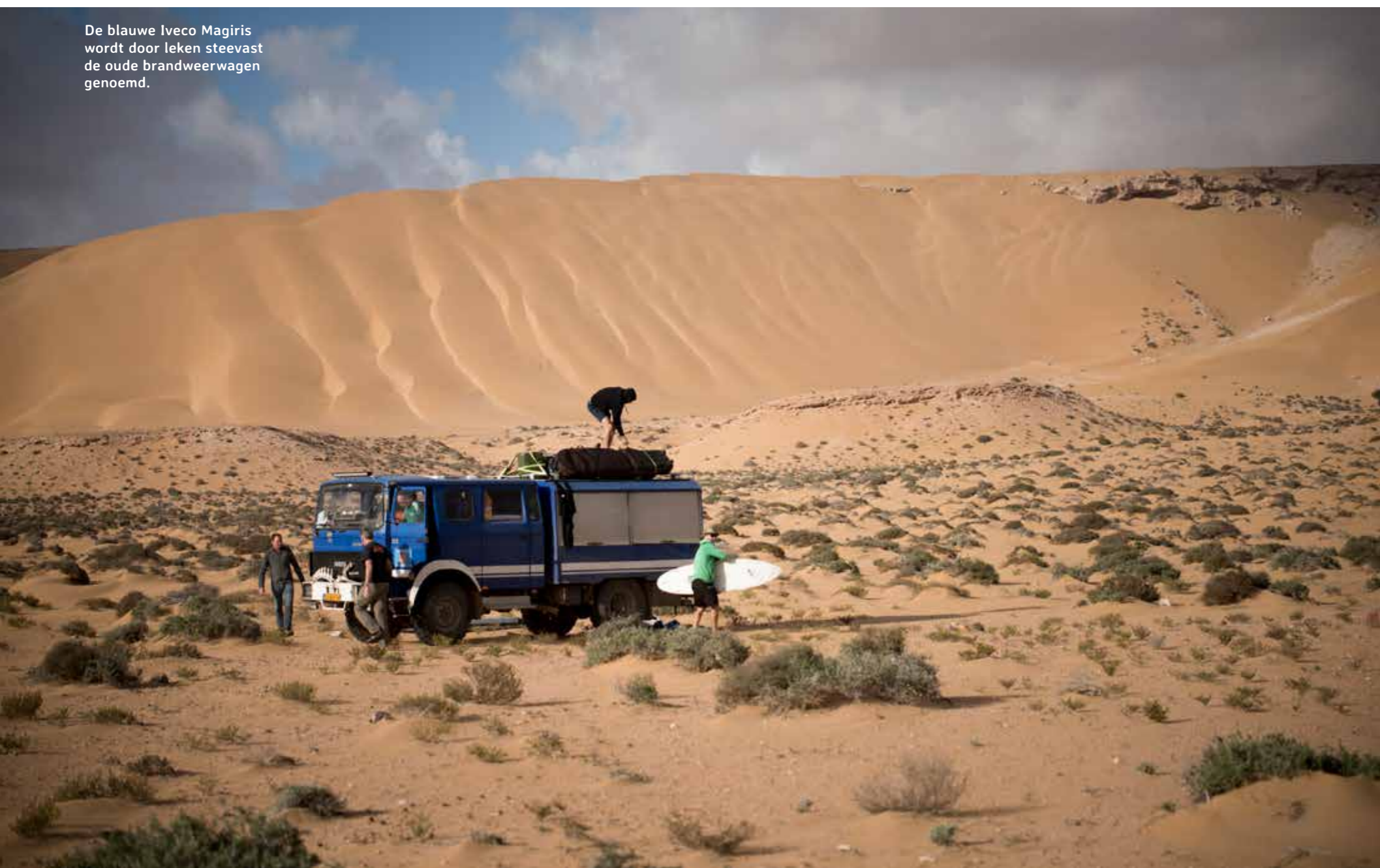
De blauwe Iveco Magiris wordt door leken steevast de oude brandweervagen genoemd.