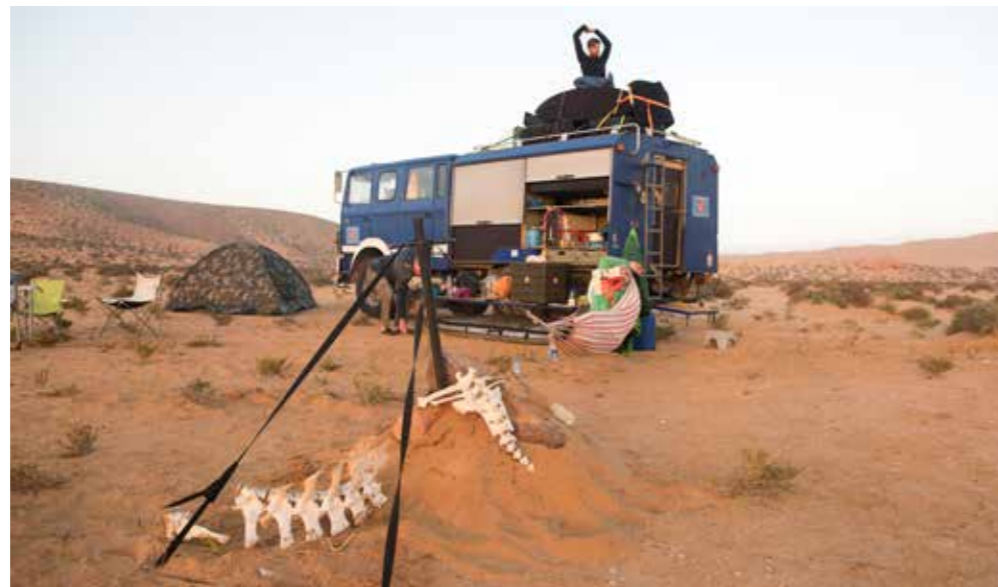
Wat couleur locale: een kamelenskelet voor op de grille (van de auto).

De volgende dag gaat al vroeg mijn wekker, een laaiende dieselmotor van een van de hijskranen in de haven. De betonblokken moeten blijkbaar vroeg het water in. Marokkanen beginnen om zeven uur met werken en dan lig ik op vakantie meestal nog te slapen. Maar ja, over een tetrapod of vijf zijn ze bij mijn 'bed' en dan zal ik er toch echt uit moeten. Maar goed, een vroege wekker heeft ook zo zijn voordelen. Golven rollen intussen rond het havenhoofd en ik kan me opmaken voor het beste antikater-